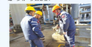
职场小白新一合格外操 汽油加氢 路秋雨

努力提升自己的专业素养和专业能力，在竞赛中取得了令自己满意的成绩和排名，完成了年初定制的目标。在认真学习的过程中，取得了一个好的成果。不积跬步，无以至千里，不积小流，无以成江海，只要努力总会有收获，不用担心路途遥远，进一步有一步的喜悦。